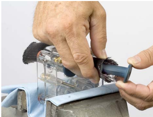
Fig. 3 Inserimento della valvola a manicotto nell'utensile di inserimento

Allineare le nervature della valvola a manicotto alle scanalature quadre della camera della valvola.