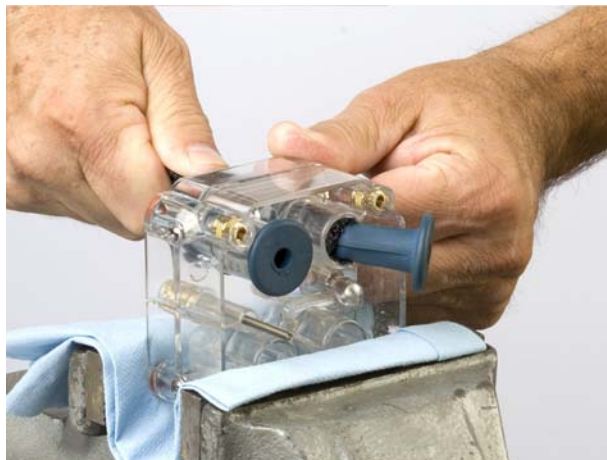
Fig. 5 Tirare la valvola a manicotto nel corpo valvola