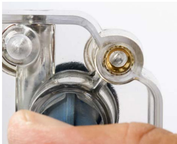
Fig. 7 Smontaggio della valvola a manicotto