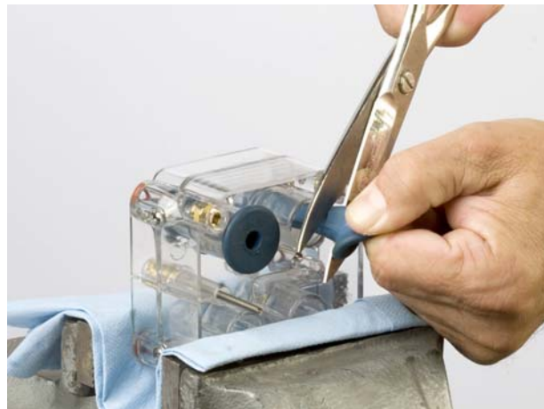
Fig. 2 Smontaggio della valvola a manicotto