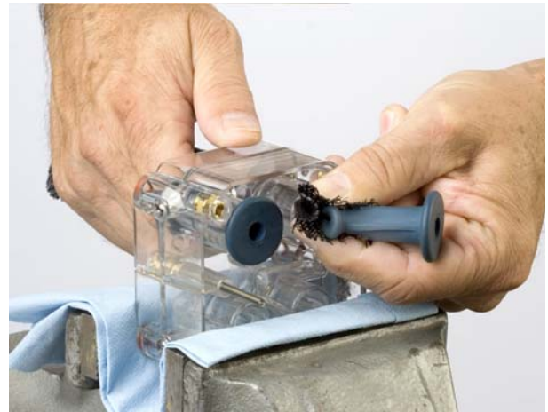
Fig. 4 Appiattire la flangia UP della valvola a manicotto