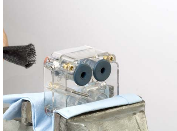
Fig. 6 Tirare la valvola a manicotto attraverso il corpo valvola