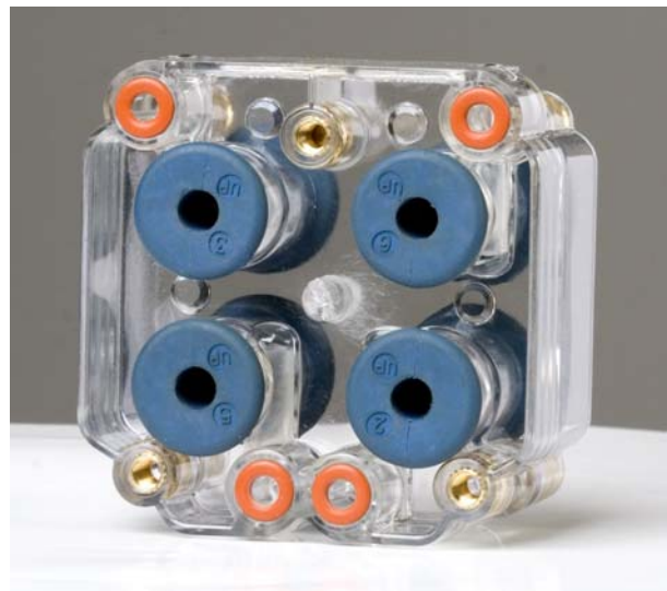
Fig. 1 Lato superiore del corpo della valvola a manicotto

Nelle flange superiori delle valvole a manicotto è modellata la parola UP (ALTO). Il lato superiore del corpo della valvola ha quattro passaggi per l'aria chiusi ermeticamente da o-ring.